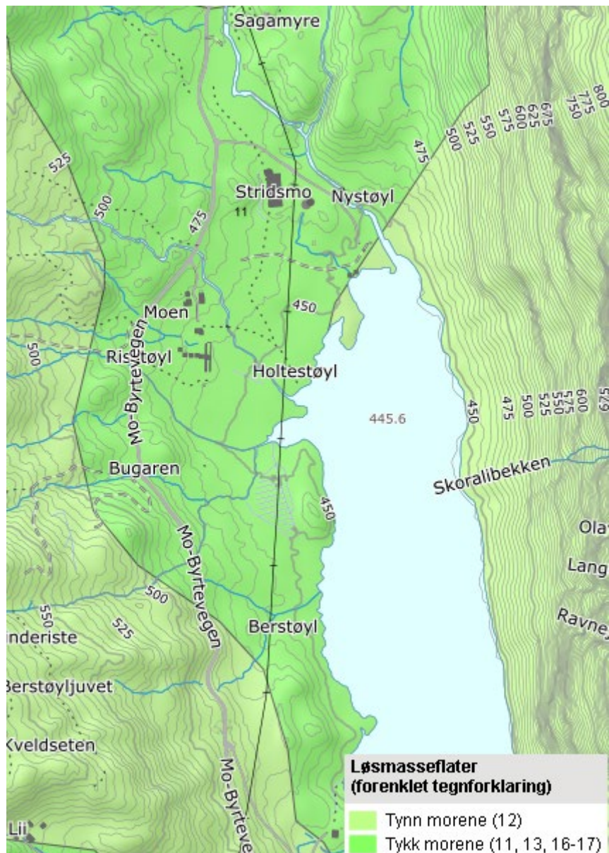
Figur 2 – Løssmassekart

Fig. 2 Viser at prosjekterte område er dekket av tykk og tynn morrene. Denne type materiale er vanligvis hardt sammenpakket, dårlige sortert og kan innholdet alt fra leir og stein blokk. Men på grunn av betydelig vannavrenning fra fjellet til Byrtevatn forventer vi ikke at det finnes leire der. Siden hele område er høyere enn Marine grense så definitivt finner vi ikke kvikkleire. Derfor, vi trenger ikke å vurdere områdestabilitet.